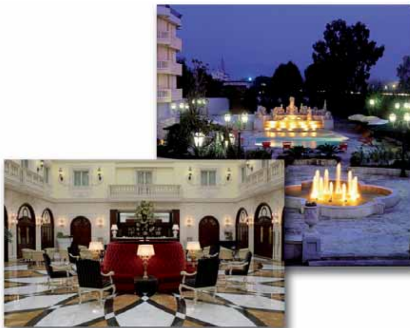
Grand Hotel Vanvitelli