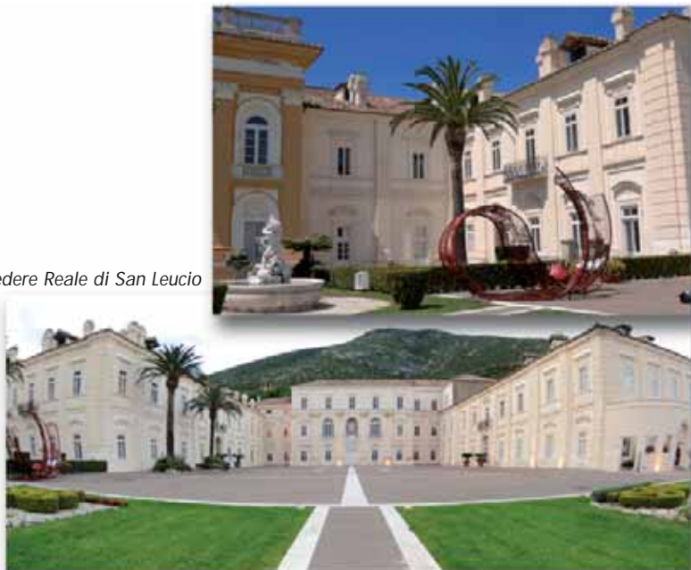
Belvedere Reale di San Leucio