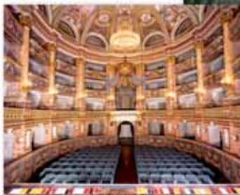
Il Teatro di Corte