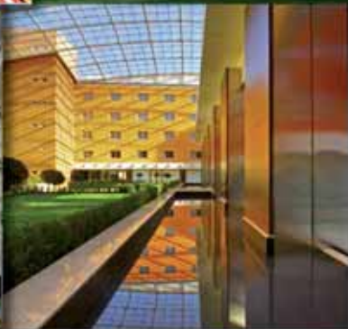
Crowne Plaza Caserta