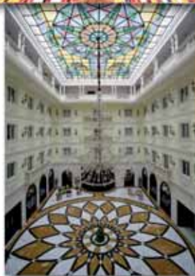
Grand Hotel Vanvitelli